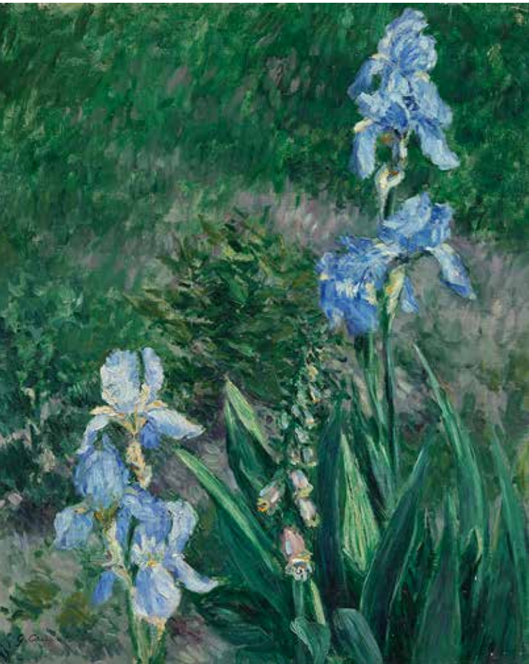
Iris bleus, jardin du petit Gennevilliers, 1892, par Gustave Caillebotte, acquise par le Musée des beaux-arts de l'Ontario